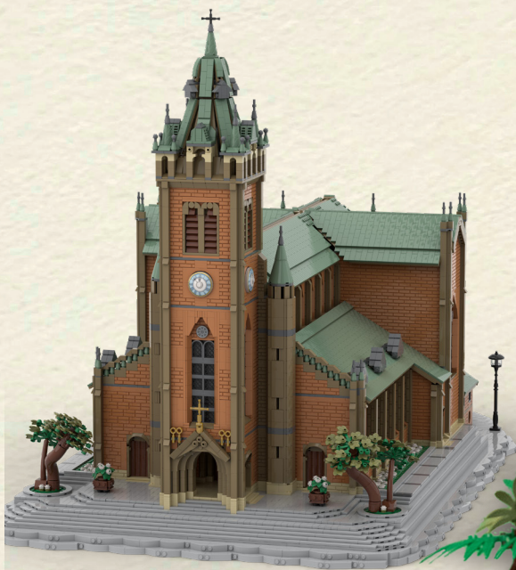
Modélisation de la cathédrale de Myeongdong à Séoul 103 x 60 x 67 cm 16 333 briques